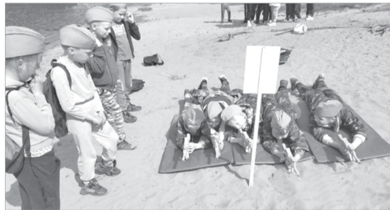
Фото участников мероприятия