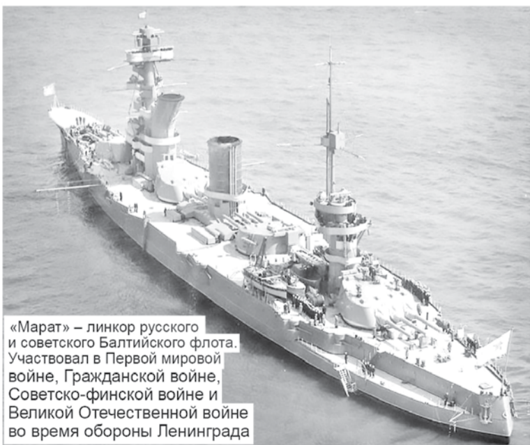
«Марат» – линкор русского и советского Балтийского флота. Участвовал в Первой мировой войне, Гражданской войне, Советско-финской войне и Великой Отечественной войне во время обороны Ленинграда

В состав флотилии вошли пять тральщиков (6-й дивизион тральщиков), шесть катеров М 0-IV и два бронекатера (дивизион сторожевых катеров), дивизион катеров-тральщиков (16 выпелов), группа кораблей специального назначения и береговые части – отдельный артиллерийский дивизион из шести батарей, зенитная батарея, стрелково-пулемётная рота, многочисленные подразделения морской пехоты и строительный батальон. В августе флотилию усилили сторожевыми кораблями «Пурга» и «Конструктор», канонерскими лодками «Лахта» и «Сестрорецк», четырьмя катерами МО-IV и двумя бронекатерами. Канлодки «Лахта» и «Сестрорецк» до войны тоже были грунтовыми шаландами, но ещё дореволюционной постройки. Канлодка «Шексна» до марта 1940 года была финским ледоколом «Ааллак». Сторожевой корабль «Конструктор» спустили на воду ещё в 1905