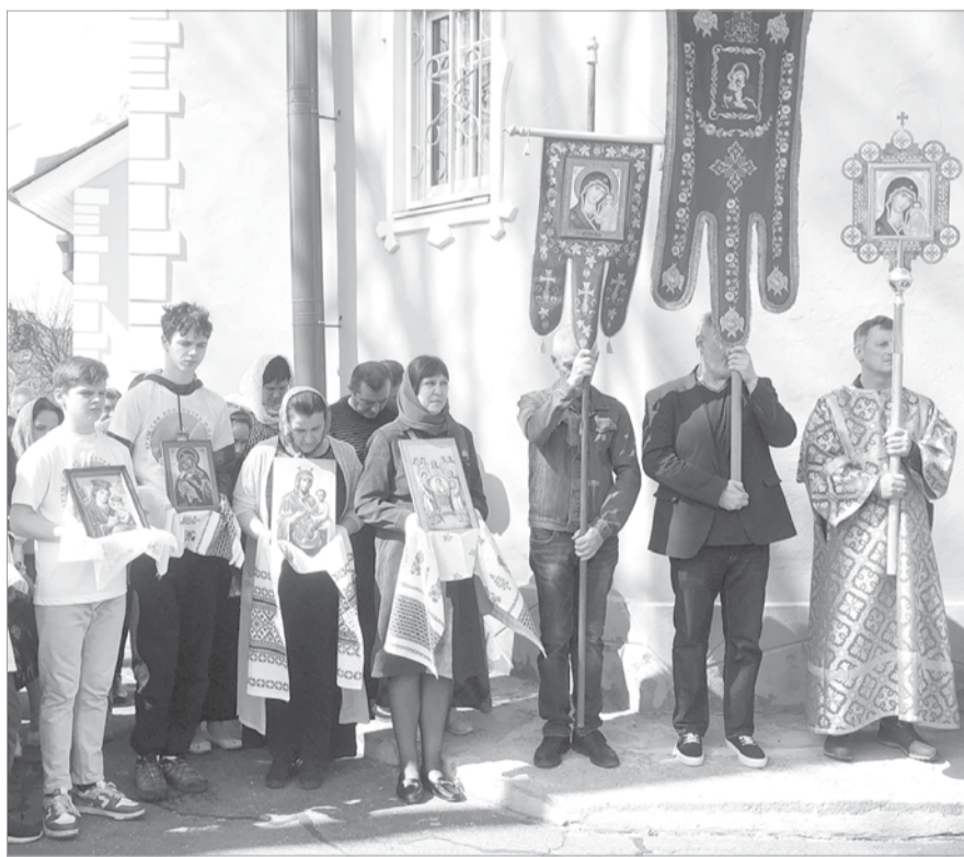
Крестный ход вокруг храма