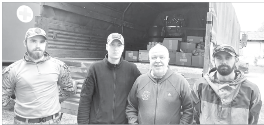
Гуманитарный груз передали землякам