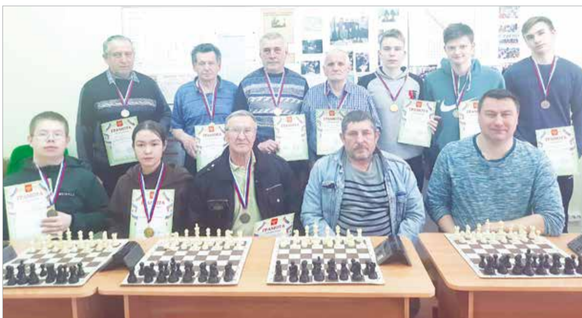
Участники шахматного турнира