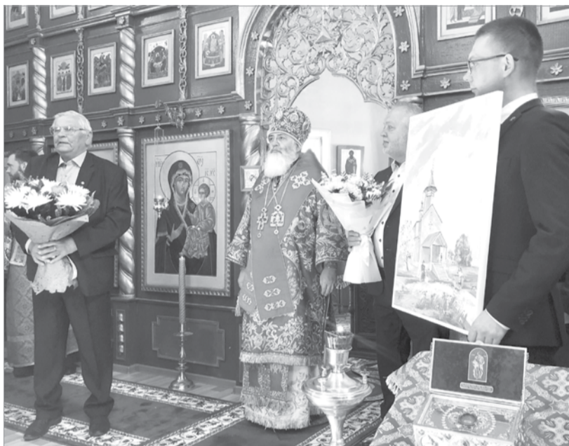
Поздравление от администрации района