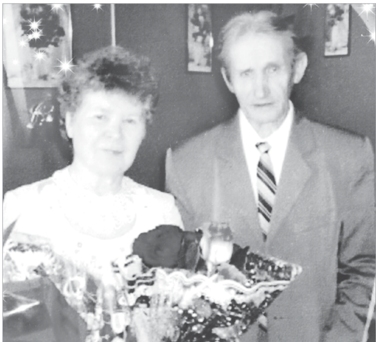
50 лет вместе (2013 год)

Светлана МИХАЙЛОВА