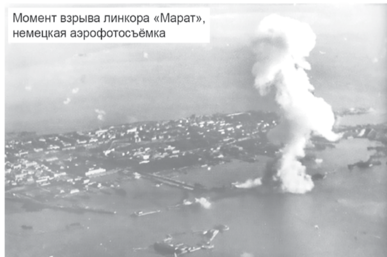
Момент взрыва линкора «Марат», немецкая аэрофотосъёмка